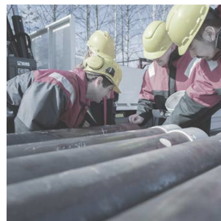
ОБСЛУЖИВАНИЕ НА МЕСТАХ