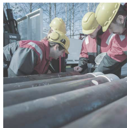
ОБСЛУЖИВАНИЕ НА МЕСТАХ