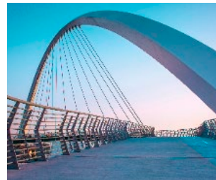
Brückenbau, Hochbau, Kranbahnträger