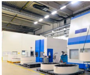
Pressen, Spritzgussmaschinen, Getriebegehäuse