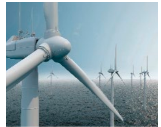
Spezialteile für Wind- und Wasserkraftanlagen