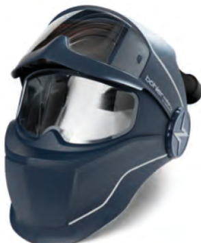
Evolution Vision 65FM Air