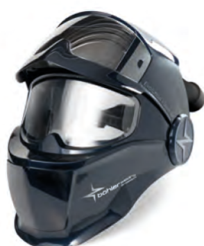
Evolution Vision 65F Air