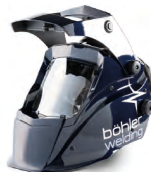
Guardian 62F Air