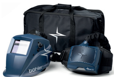
Guardian 50M Air Kit z Guardian 50M Air: