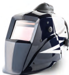
Guardian 62 Air