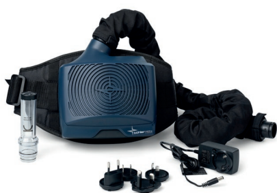
Guardian Air Kit (Kompletny zestaw filtracyjno-nawiewowy)