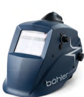
Guardian 50M Air