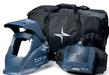
Guardian 50FM Air Kit z Guardian 50FM Air: