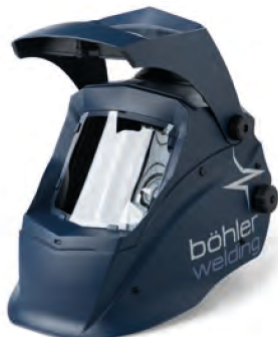
Guardian 50FM Air