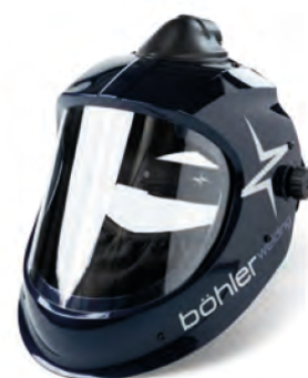
Big Vision Air