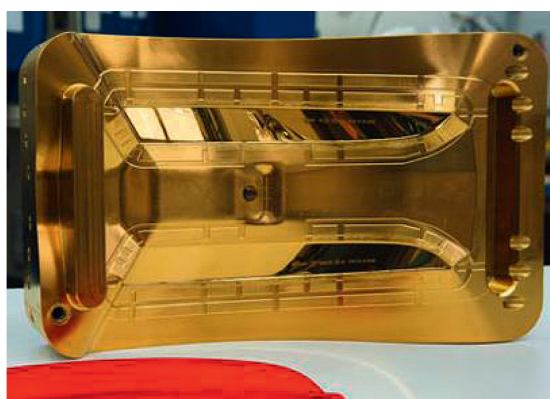
Eine mit TiN-ultrafinebeschichtete Form für den Einsatz im Kunststoffspritzguss (vorne die gefertigte Kunststoff-Blende für den Automobilbereich).

Die glatte und glänzende TiN-ultrafine Schicht wird durch den Einsatz unserer SPCS-Technologie erreicht. SPCS steht für „ S trongly P oisoned C athode S urface“ und beschreibt unser spezielles PVD-Arc-Beschichtungsverfahren, bei dem wir durch eine innovative Gassteuerung hervorragende Schichteigenschaften produzieren können.