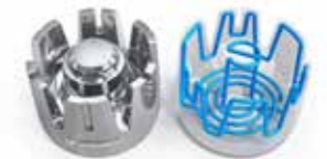
Refroidissement ciblé sur les points chauds