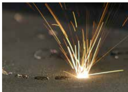
Fusion laser sur lit de poudre

Les Centres d'Excellence utilisent l'équipement provenant des fournisseurs principaux de la Fabrication Additive, aussi bien pour la fusion laser sur lit de poudre que pour le dépôt par fusion laser . En travaillant avec les deux technologies de production, issues de différents fournisseurs, voestalpine possède la flexibilité et l'expertise pour sélectionner le meilleur procédé de production de Fabrication Additive adapté à votre besoin.