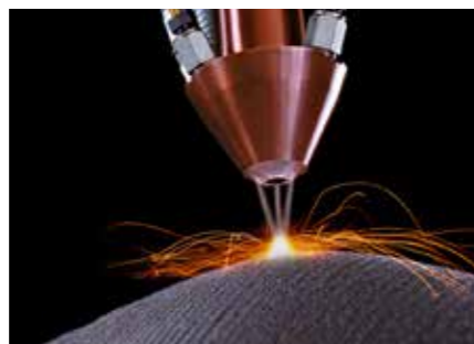
Dépôt par fusion laser