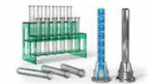
Au-delà des simples lignes droites