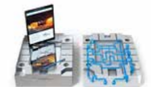
Une production flexible de vos moules